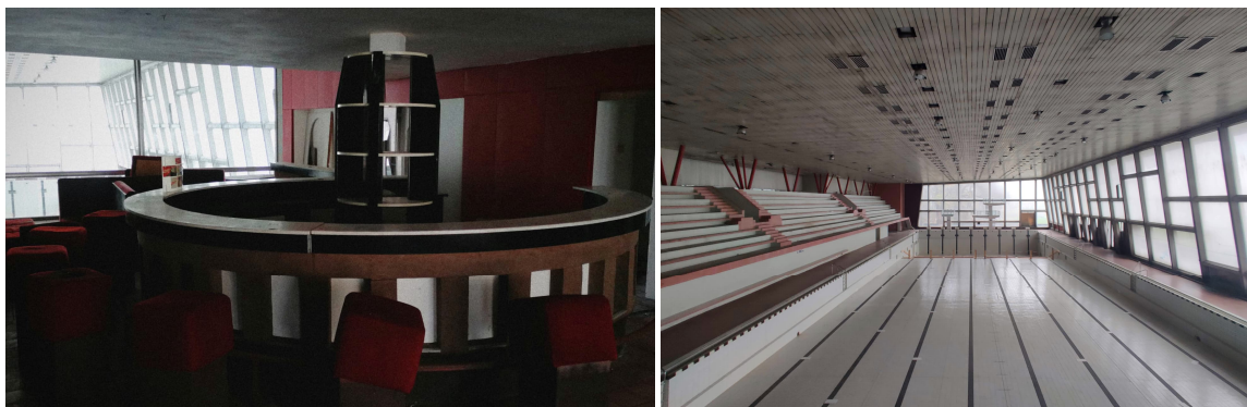
Obr. č. 2 – Stávající stav interiérů