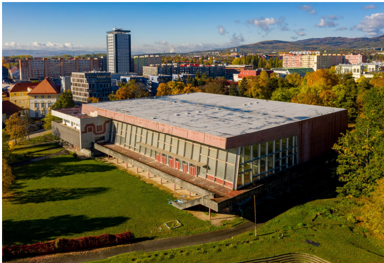
Obr. č. 1 – Stávající objekt

Povrchové úpravy obvodových stěn obou částí objektu jsou převážně řešeny obklady keramickou mozaikou, v kombinaci načervenalé a šedé barvy, korespondující s hliníkovými prvky obvodového pláště.