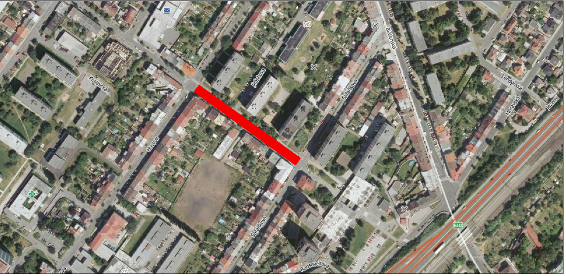
letecký snímek okolí ulice Jiráskova – rekonstruovaná část je vyznačena červeně

JIRÁSKOVA - 50 PARKOVACÍCH MÍST Z TOHO 2 PRO ♿