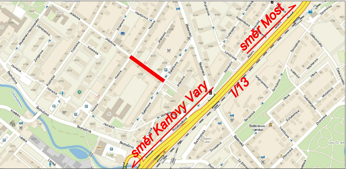
mapa okolí ulice Jiráskova – rekonstruovaná část je vyznačena červeně