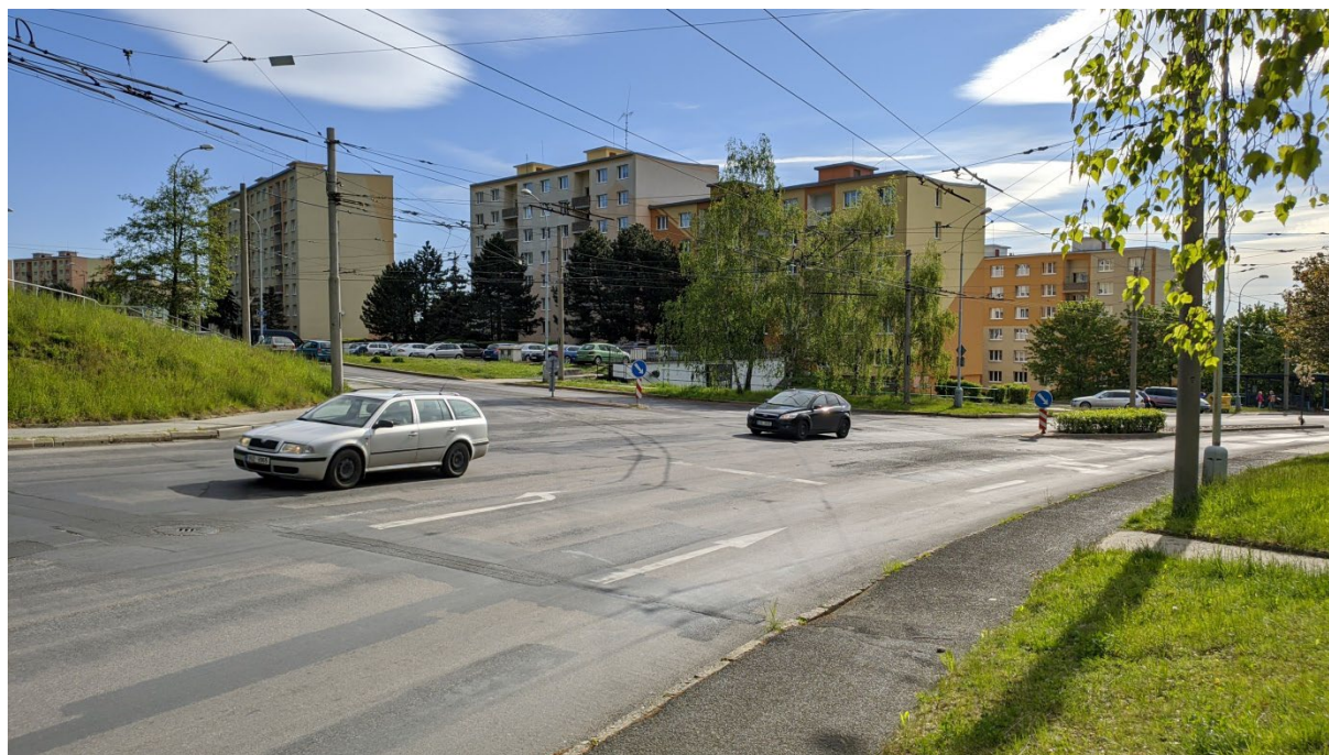
Obrázek 3 - Rekonstrukce trakčního vedení v křižovatce ul. Kamenná a ul. Zahradní – foto

Rekonstrukce nosných sítí, trolejbusových tras a všech výhybek trakčního vedení v oblasti křižovatky