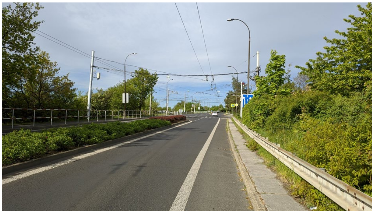
Obrázek 1 - Rekonstrukce trakčního vedení v křižovatce ul. Písečná u DPCHJ – foto

Rekonstrukce trakčního vedení v oblasti křižovatky ulice Písečná v blízkosti DPCHJ ve městě Chomutově pro zajištění stabilizace páteřní sítě, resp. plynulost trolejbusové dopravy a méně oprav, z důvodu havarijního stavu armatur.