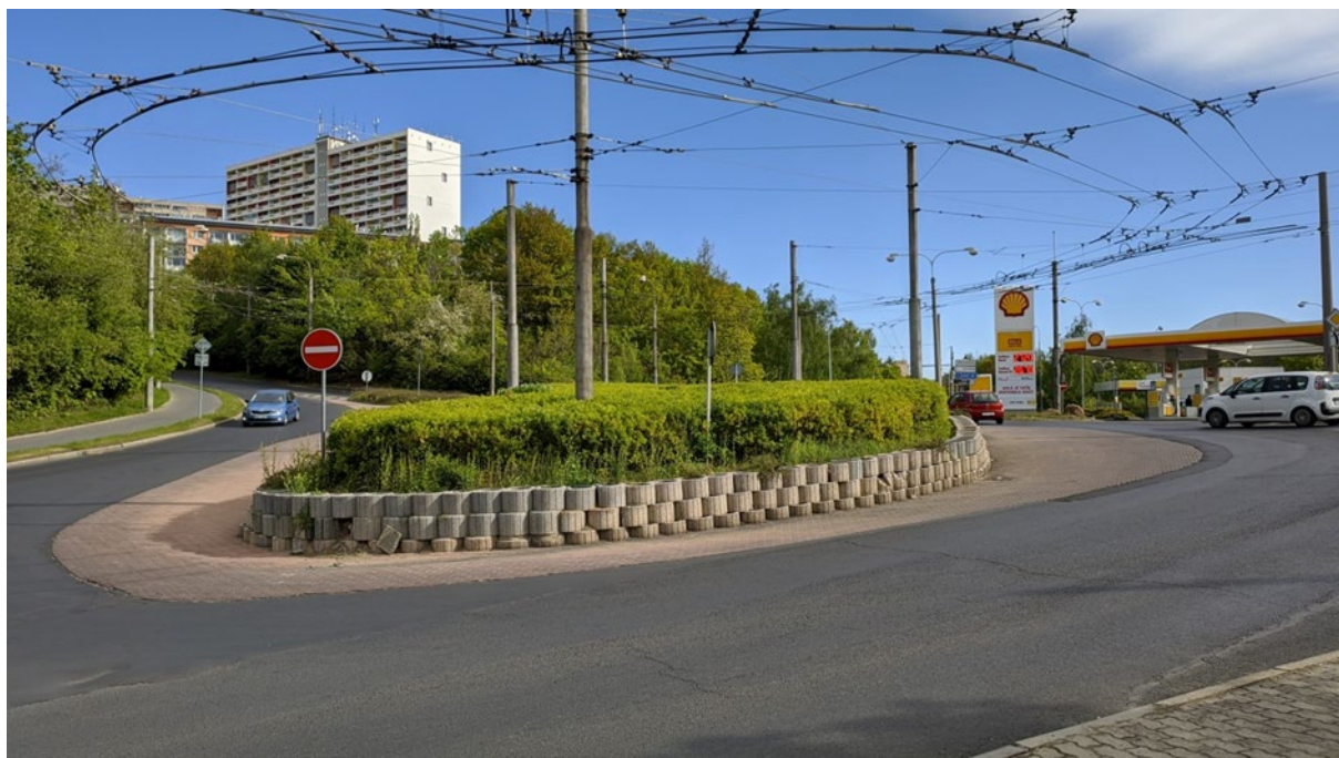
Obrázek 2 - Rekonstrukce trakčního vedení v křižovatce ul. Březenecká u měnirny č. 2 - foto

Rekonstrukce nosných sítí, trolejbusových tras a všech výhybek trakčního vedení v oblasti křižovatky ul. Březenecká u měnirny č. 2 ve městě Chomutov.