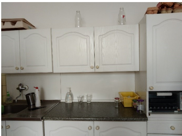
Obrázek 1 prostor pro dva dřezy