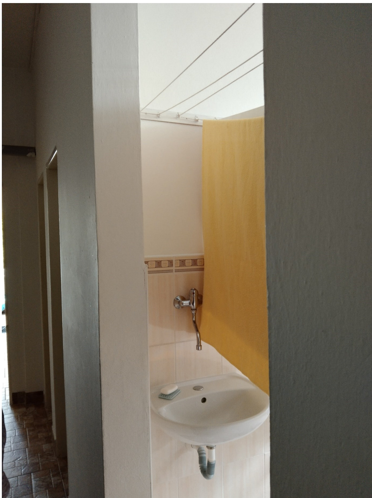
Obrázek 1 místo na možnost vybudovat bezbariérové toalety