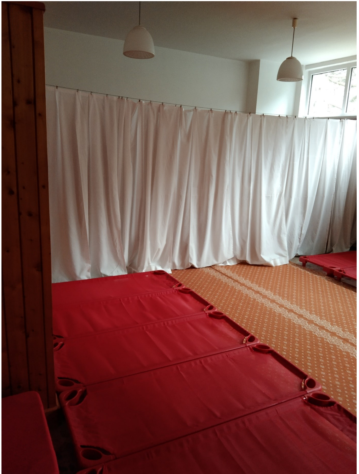
Obrázek 3 prostor pro vybudování relaxační zóny s kachličkovými lehátky za záclonou – zastínění elektricky ovládané – červená lehátka vyměníme za dřevěná lehátka – obložení možné zanechat – obrousit a natřít voděodolným lakem, aby se to dobře udržovalo