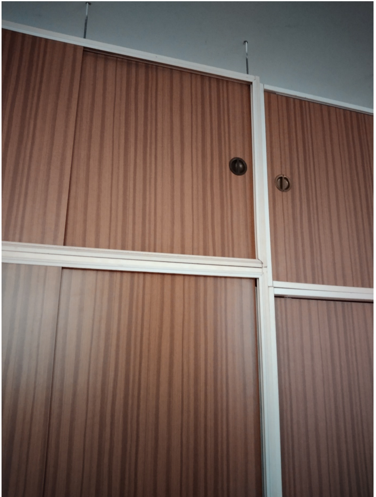
Obrázek 2 místo na lehátka ve vzduchu