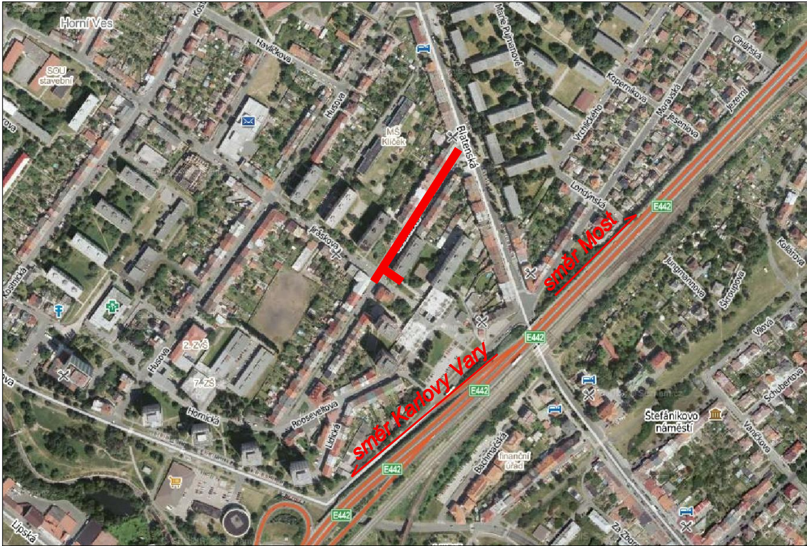
letecký snímek okolí ulice Šafaříkova – rekonstruovaná část je vyznačena červeně

ŠAFAŘÍKOVA 1. etapa - 73 PARKOVACÍCH MÍST Z TOHO 4 PRO ♿